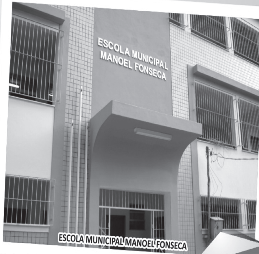
ESCOLA MUNICIPAL MANOEL FONSECA

Mais uma obra da Prefeitura de Barra do Pirai