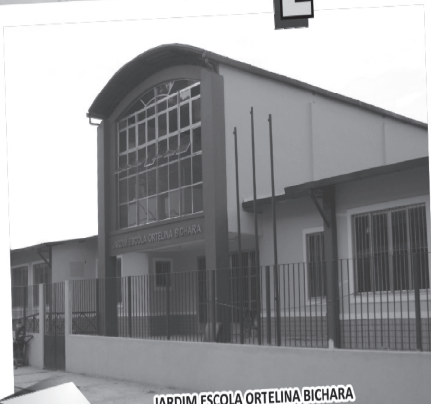
JARDIM ESCOLA ORTELINA BICHARA